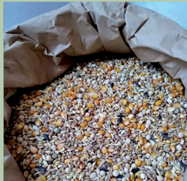
Körner und Samen