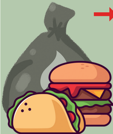
Abfall und Essensreste